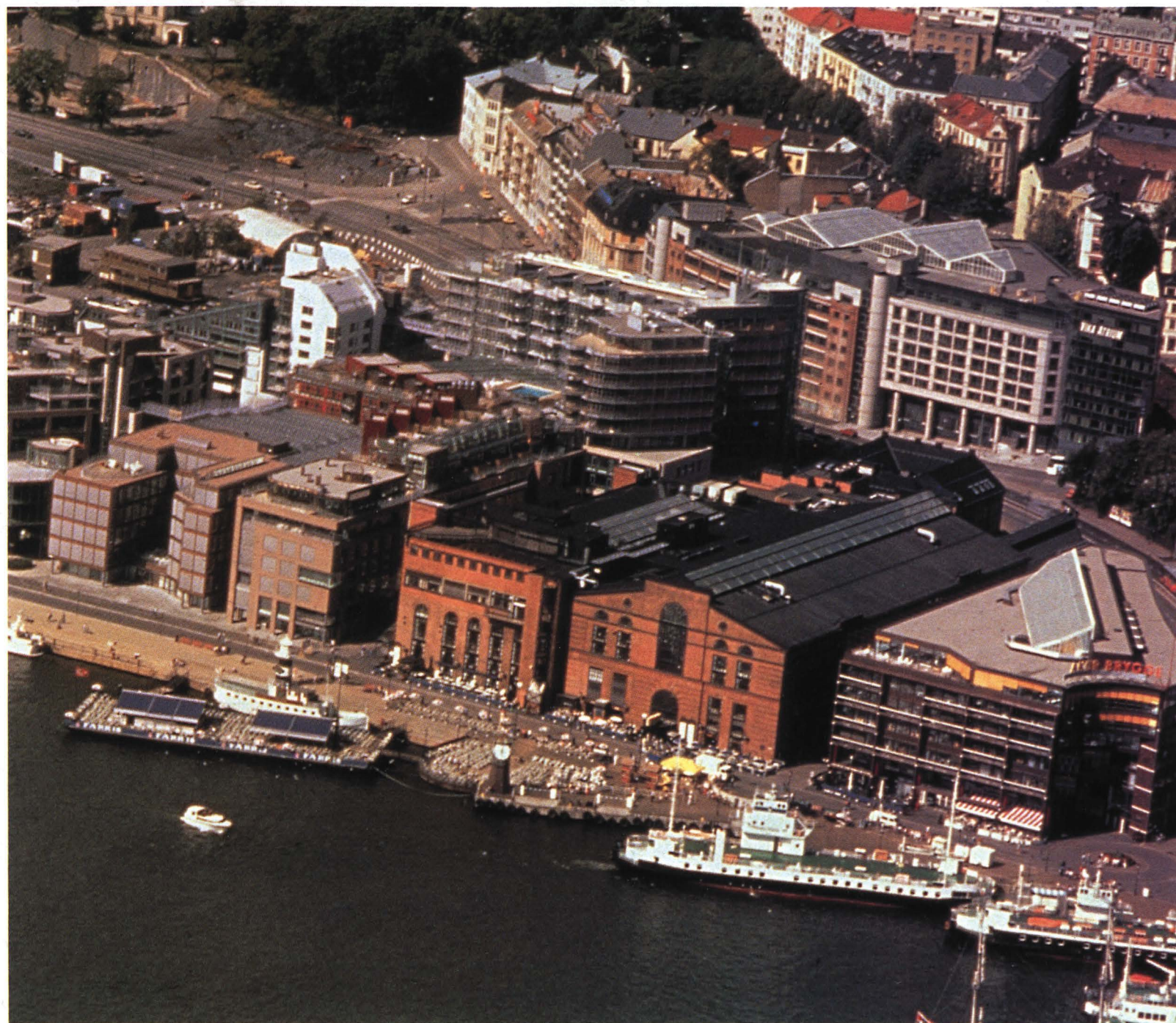
Imágenes superiores, vistas nocturnas de la zona. Fotografía inferior, panorámica actual de la bahía de Pipervika, objeto del proyecto Aker Brygge.